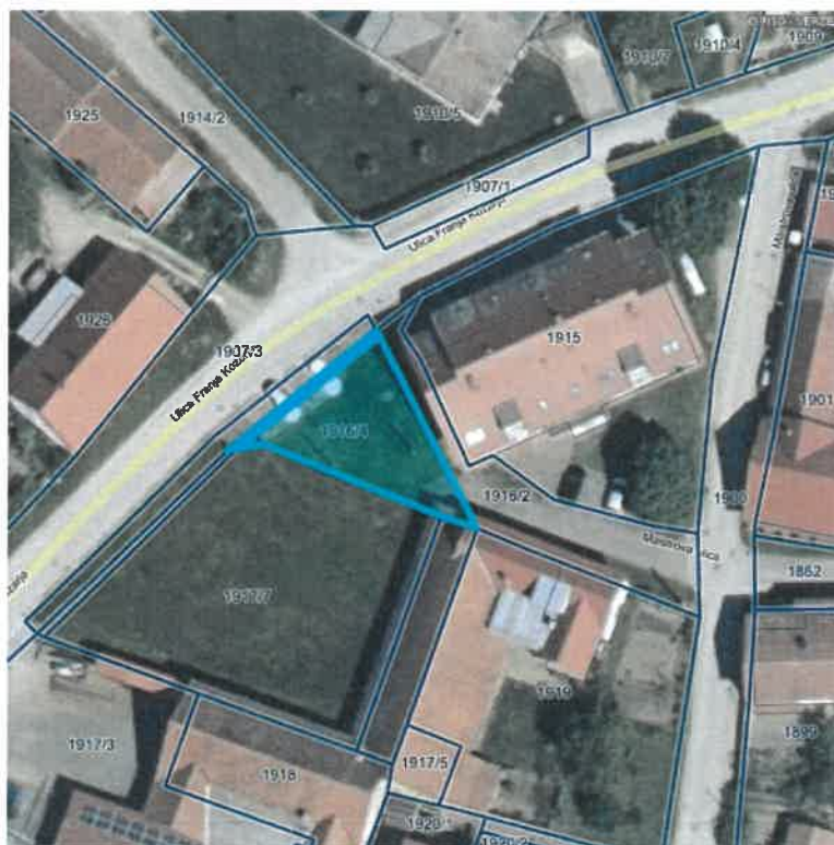
Grafični prikaz k tč. 3